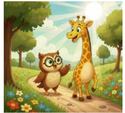
Koosje en Keesje