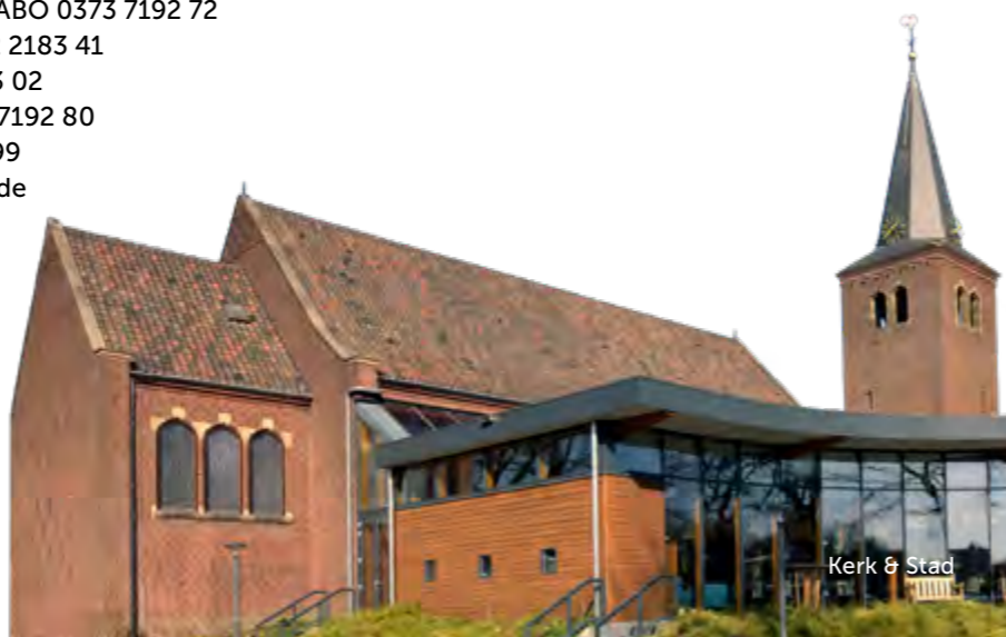
Kerk & Stad

NL26 ABNA 0445 2531 50 NL23 RABO 0373 7371 49 NL66 ABNA 0554 4765 92