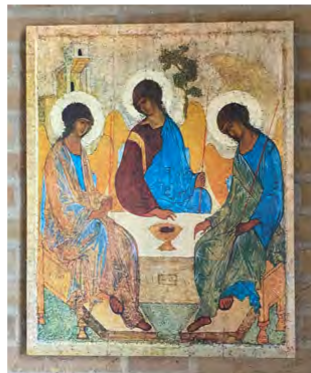
icoon in het Stiltecentrum van de Ontmoetingskerk die ook wel doet denken aan de "Emmaüsgangers"

Er steekt een nieuwe frisse wind op in de Emmaüsmensen. Levensadem en Geestkracht vervult hen, zoals die ook mij vervult en naar ik in stilte hoop ook stormachtig in u en jou!